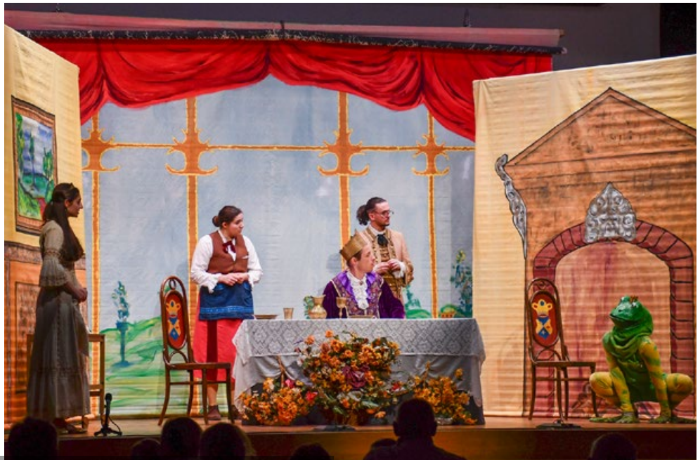
Das Reisetheater begeisterte die Kinder mit ihrer Geschichte rund um eine Prinzessin.